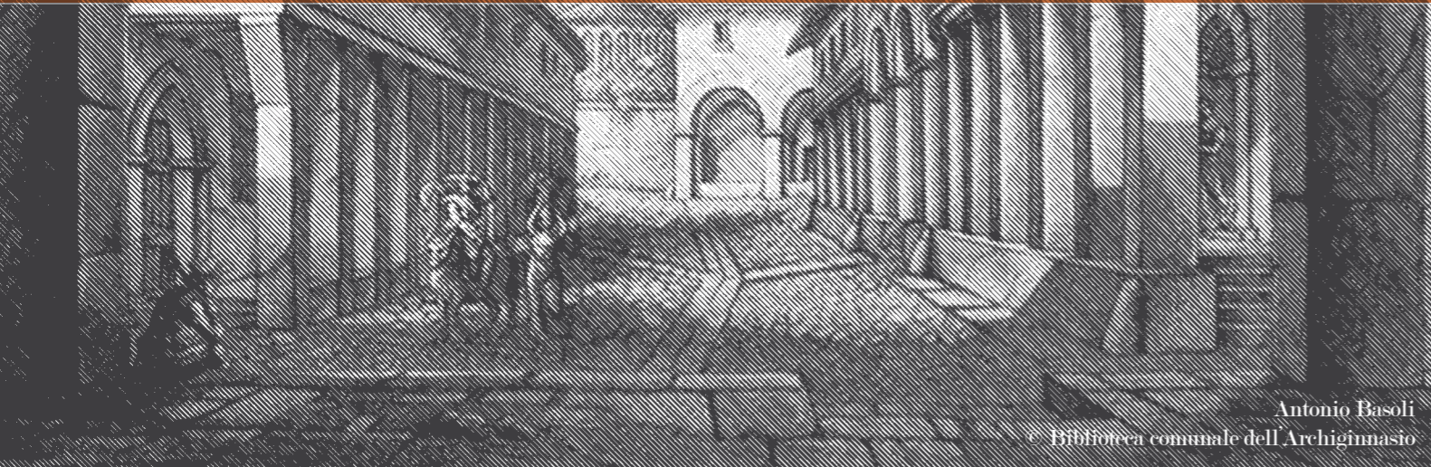
Antonio Basoli

Per informazioni / Information: Dipartimento Economia e Promozione della Città Comune di Bologna tel. ++39 051 2195951 candidatureporticiunesco@comune.bologna.it